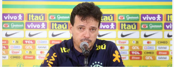
Fernando Diniz, treinador

Uma série de fatores pode ser listada para tentar esclarecer o desinteresse, muito menor do torcedor com a seleção brasileira nos dias atuais, em relação ao que existiu no passado. Mesmo para a televisão, a disputa que havia pelos seus direitos ou mesmo o entusiasmo pela transmissão dos jogos, diminuiu bastante no decorrer dos tempos. Por exemplo, a Copa América que entrará em jogo entre 20 de junho e 14 de julho do ano que vem, ainda está com a bola pingando na área. Nenhuma TV fechou até agora, algo inimaginável em outros tempos, a menos de um ano da sua realização. E mesmo a próxima Copa do