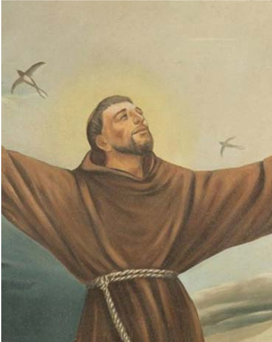
São Francisco buscava elementos na natureza como forma de chegar até Deus