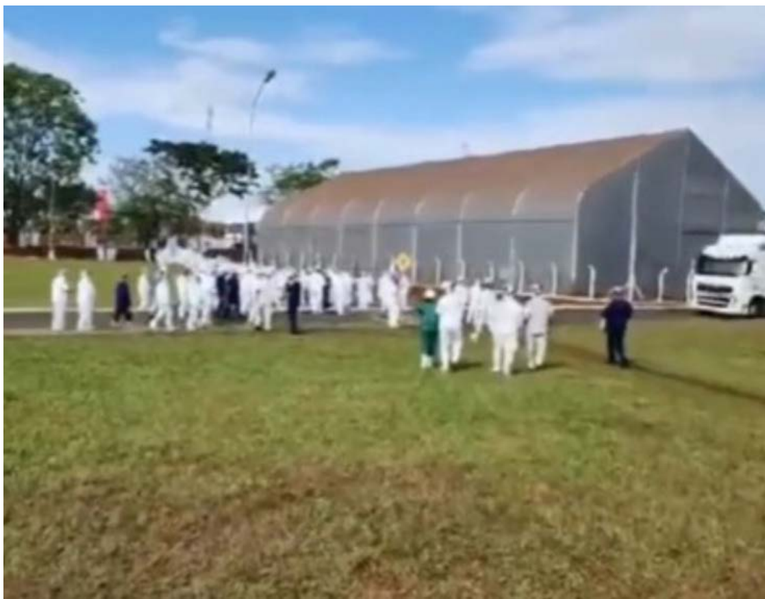
Mais um vazamento de amônia na BRF

Em resposta, a BRF informa que o vazamento era de pequenas proporções, detectado por seus sistemas de segurança, e controlado rapidamente. Para seguir os protocolos de segurança, a companhia então evacuou o local.