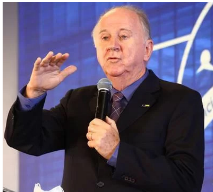
Paulo Ziulkoski: grave crise financeira das prefeituras brasileiras

2 mil prefeitos brasileiros estão em Brasília em busca de apoio do governo Lula e do Congresso para superar crise financeira