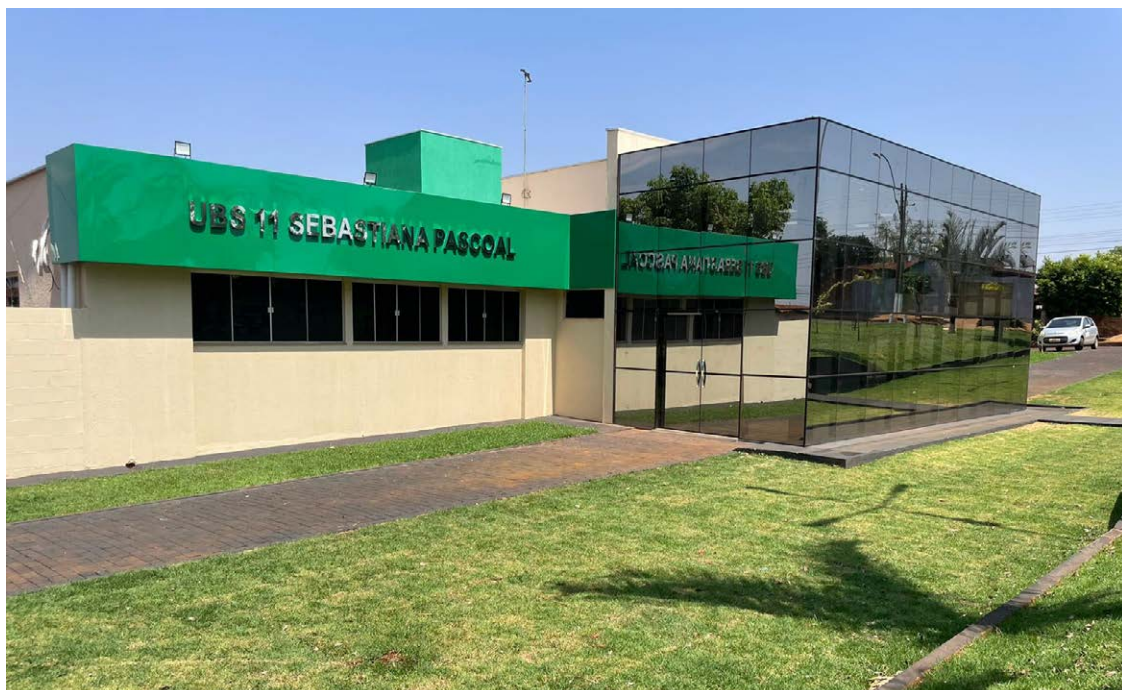
O município investiu R$700 mil reais nas obras realizadas na unidade de saúde

Os moradores do entorno também poderão realizar exames de ultrassonografia na clínica móvel do programa Saúde em Movimento que estará disponível durante todo o dia na UBS