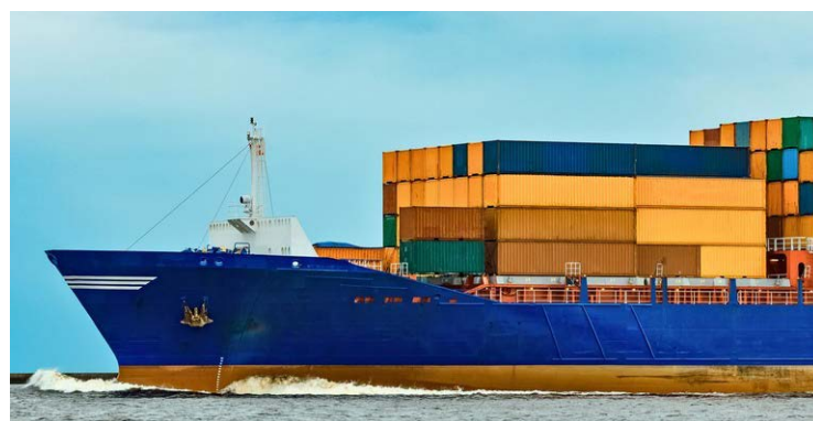
Com 51 novos mercados abertos, Brasil diversifica exportações do agro para o mundo

De acordo com a análise da Secretaria de Comércio e Relações Internacionais (SCRI/Mapa), entre os principais mercados alcançados destacam-se a comercialização para