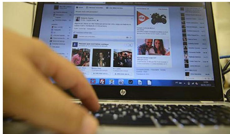
Grupos direitistas são mais isolados e muito mais coesos nas redes sociais

No Twitter, grupos de direita eram controlados por pequeno número de influenciadores, permitindo hierarquia mais rígida e agilizando difusão coordenada de informações durante as eleições