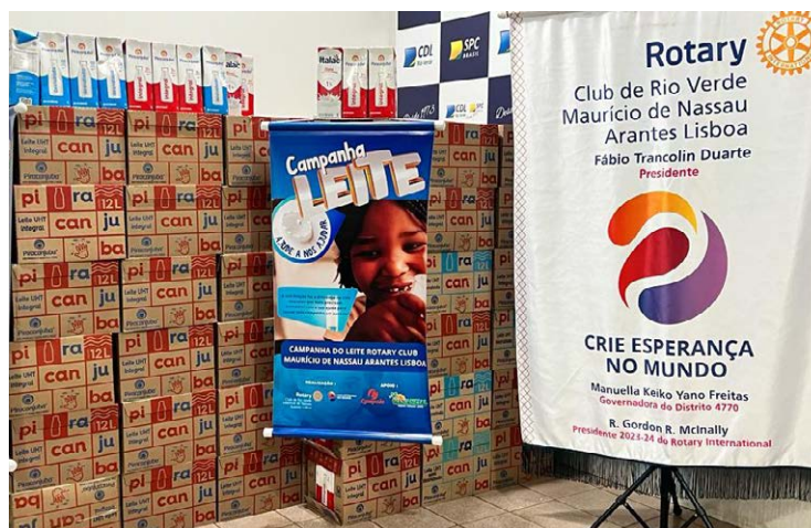
Doações da campanha.

Neste trabalho, o Rotary Club também agradeceu de forma especial, à Câmara de Dirigentes Lojistas (CDL) de Rio Verde e o Campeão Supermercados. "Foi uma jornada emocionante e edificante. Continuaremos a trabalhar incansavelmente para servir nossa comunidade e promover o bem-estar de todos os seus membros", ressalta a nota. As doações recebidas no dia serão destinadas às entidades beneficentes locais.