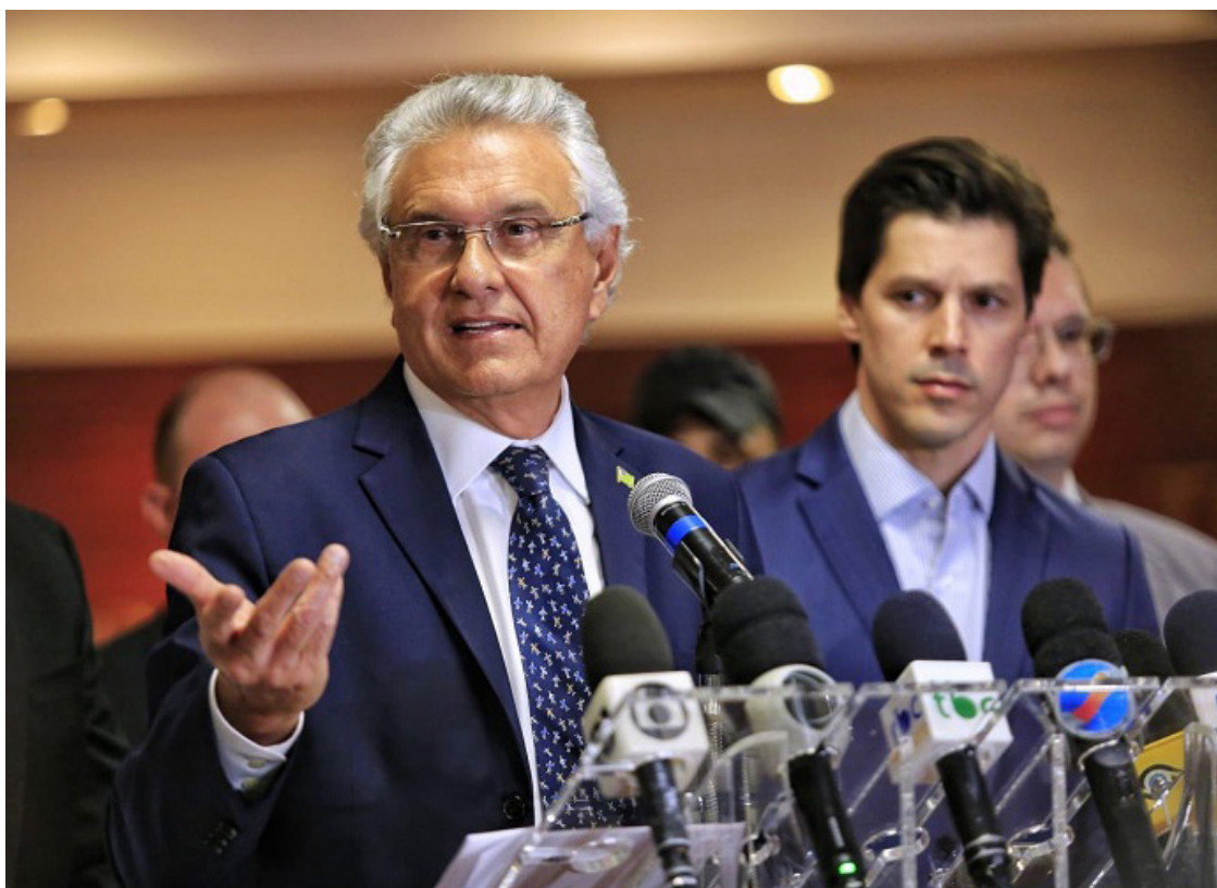
Ronaldo Caiado: sem data para discutir apoio às eleições em Goiânia

“Todos os partidos estão se mexendo e muitos colocam seus nomes, mas isso não pode