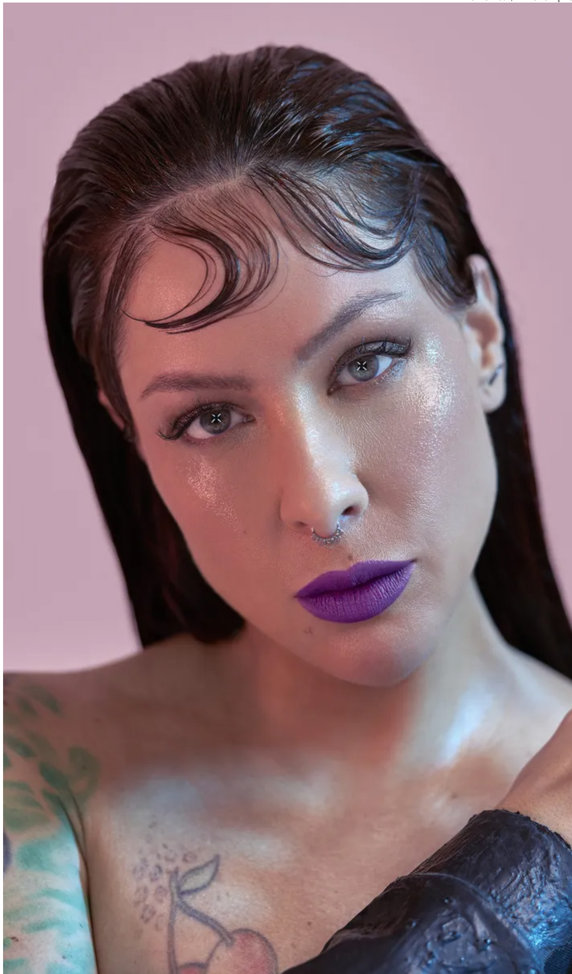
Fôlego novo: cantora colocou álbum dentre os mais importantes do rock brasileiro

Assim que "Admirável Chip Novo" saiu, em 2003, Pitty cos-