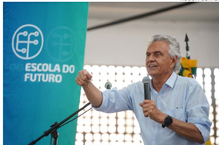
Escola do Futuro de Valparaíso de Goiás é inaugurada pelo governador Ronaldo Caiado

Já pela Agência Goiana de Habitação (Agehab), foram